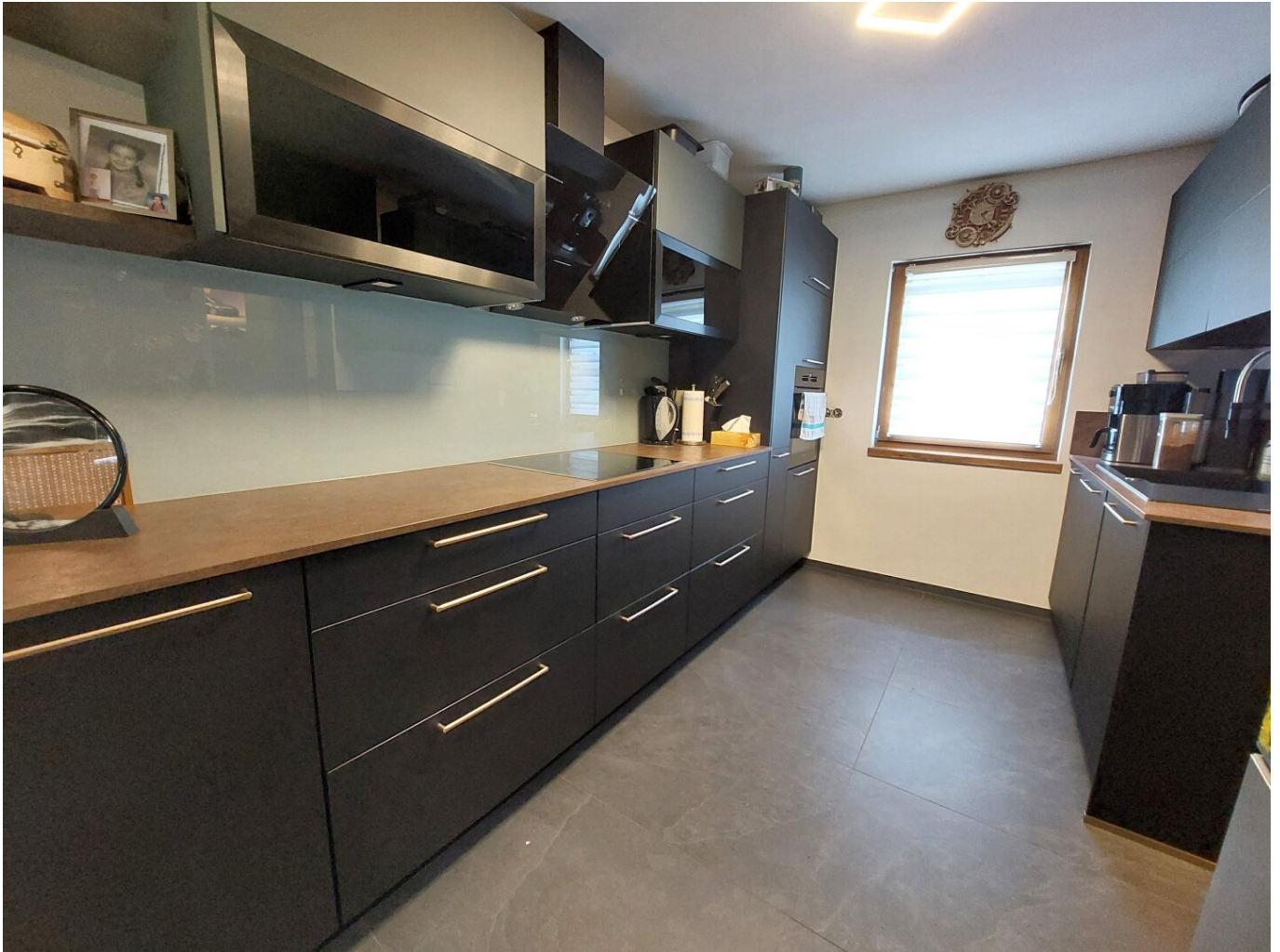
moderne, neuwertige Küche

Moderne Eigentumswohnung. Leistbar und sofort verfügbar!