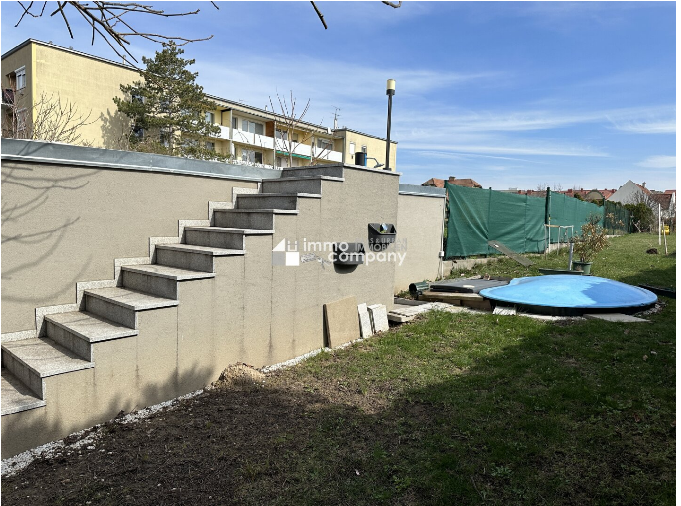
Sicht auf Garage