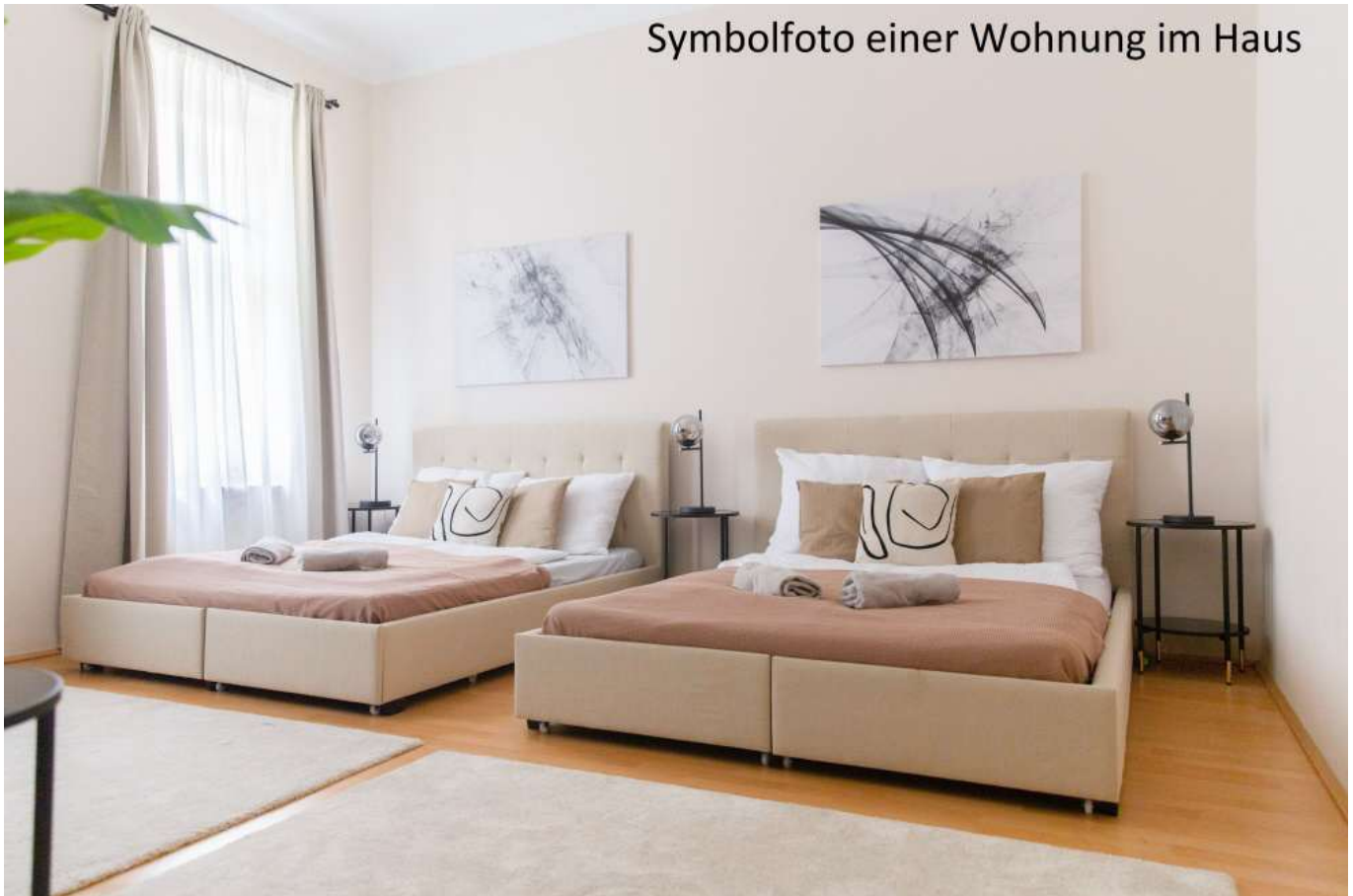
Symbolfoto einer Wohnung im Haus