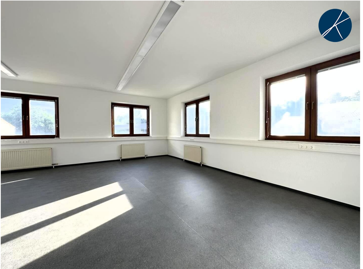
neu sanierte Bürofläche (Musterfoto)