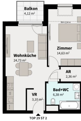
TOP 29 ST 2