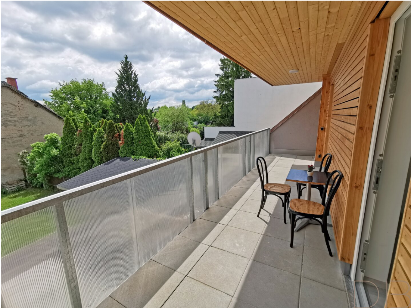
10m 2 Terrasse