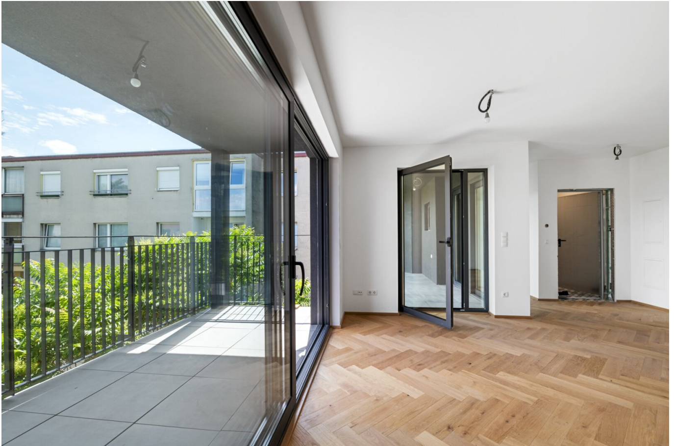
Ansicht Wohnküche mit Terrasse und Loggia