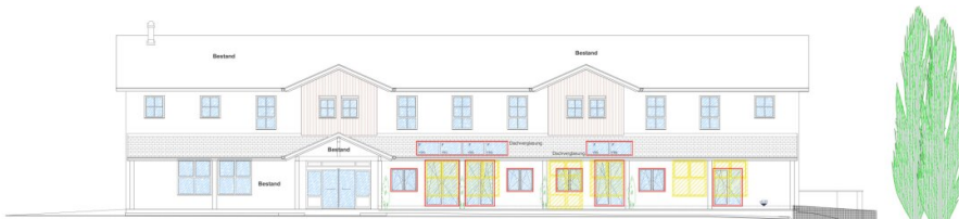
Nordwest M 1:100