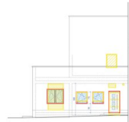
Südost M 1:100