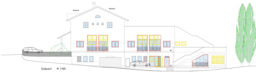
Südwest M 1:100