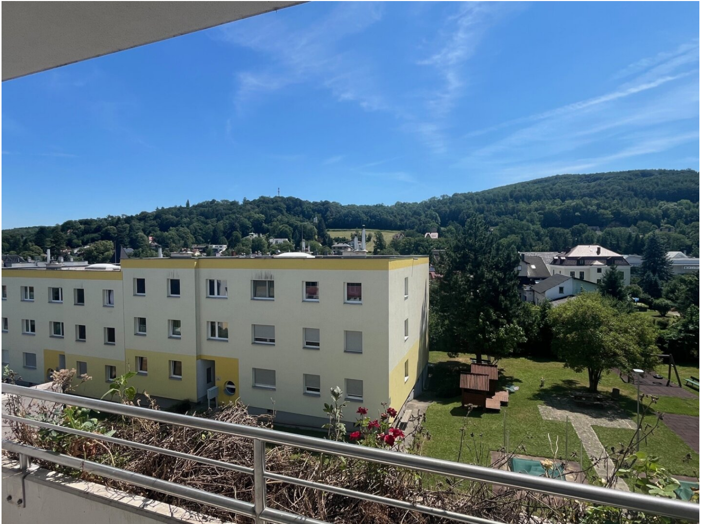
Ausblick Loggia 1