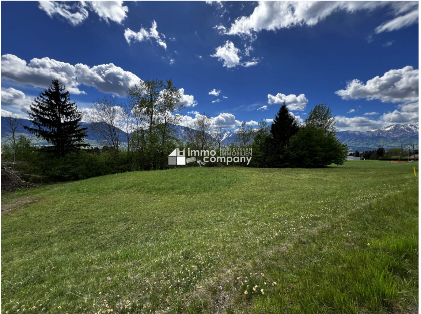
Baugrund Ludmannsdorf 1