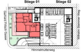
Erdgeschoß Stiege 1 Top 1,1-2 M=1:150

Die dargestellte Möblierung ist nur ein Lösungsvorschlag. Sanitärerichtung und Küchenanschlüsse werden mitangeboten. Änderungen aus technischen oder baubehördlichen Gründen vorbehalten.