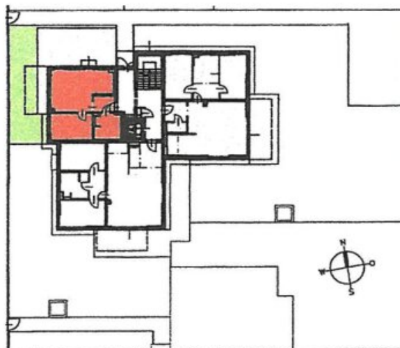
Lage in der Anlage