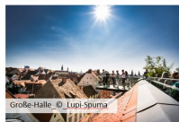
Große Halle

Die Grazer Innenstadt bietet ein vielfältiges Angebot und pures Einkaufserlebnis. Kastner und Öhler ist Österreichs schönstes Kaufhaus und bietet von der Dachterasse einen großartigen Rundblick.