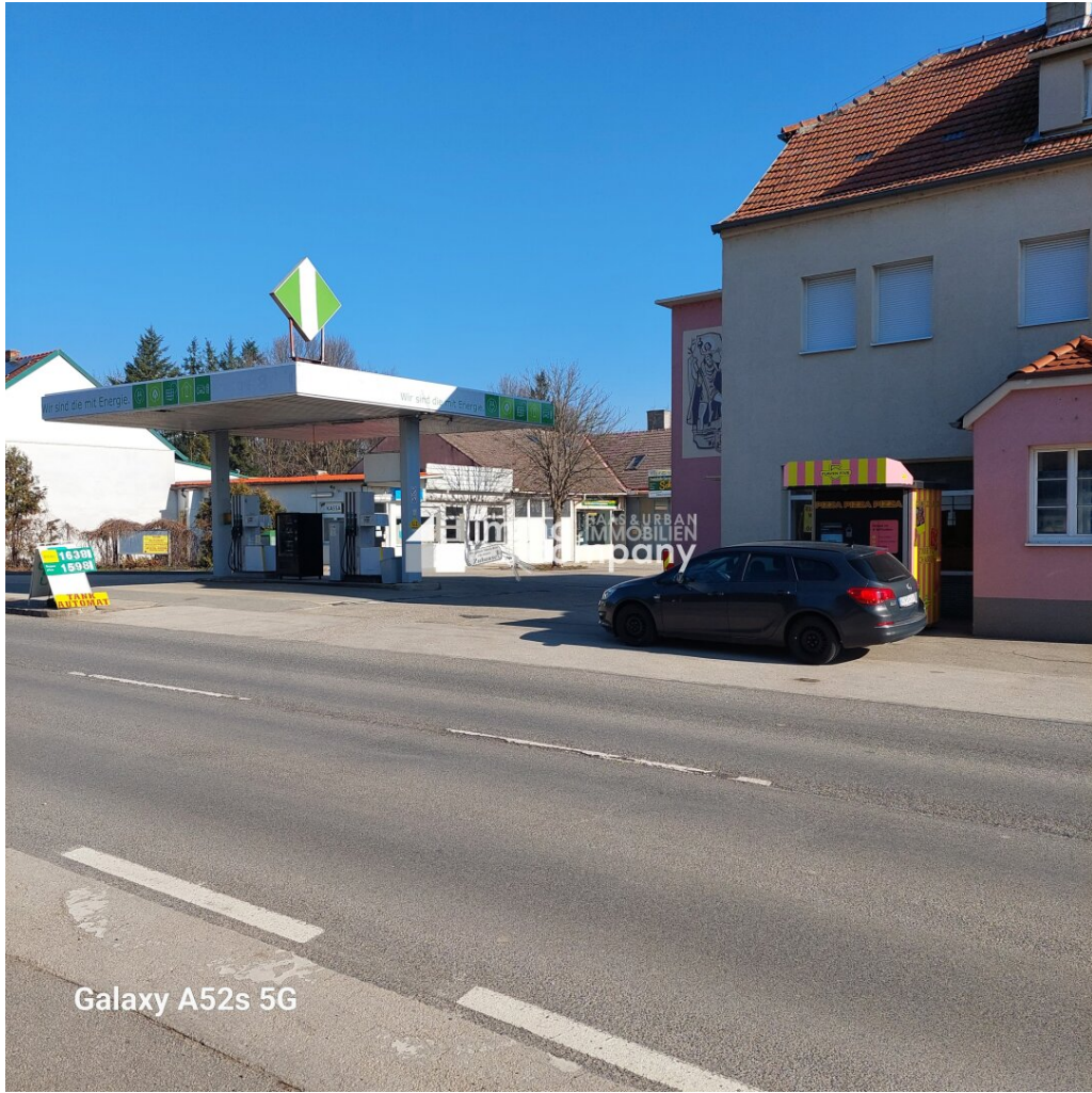
Galaxy A52s 5G