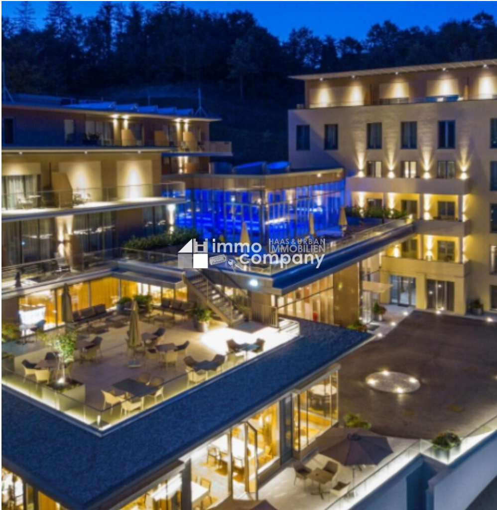
Hotel 5* nahe Gesundheitszentrum und Thermen