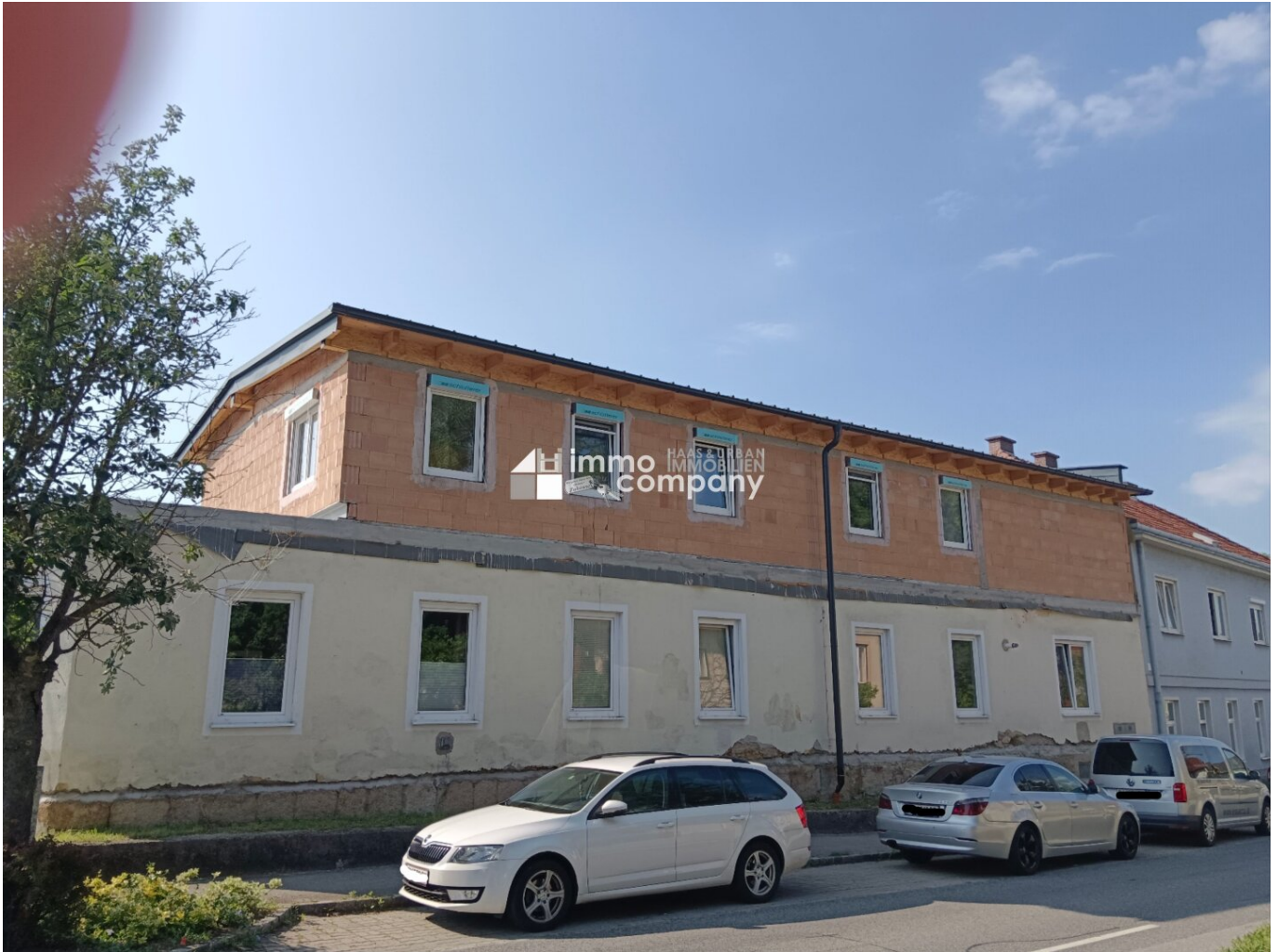
Straßenansicht mit Terrasse