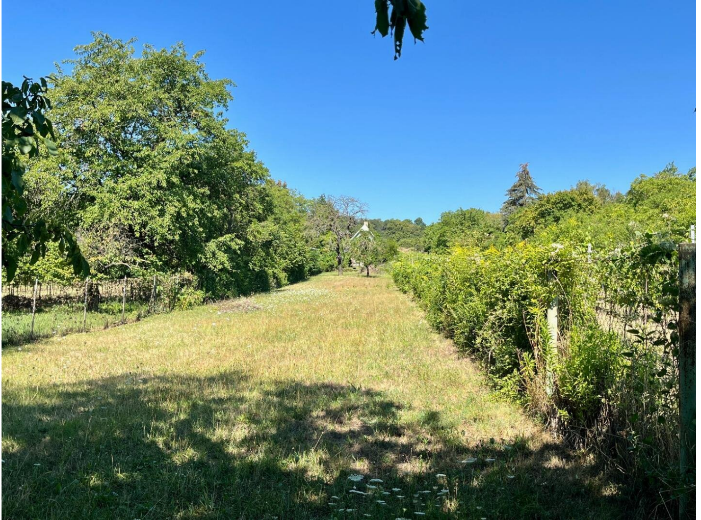
Blick Richtung Westen

Objektnummer: 7753/1028 Eine Immobilie von IMMONATION