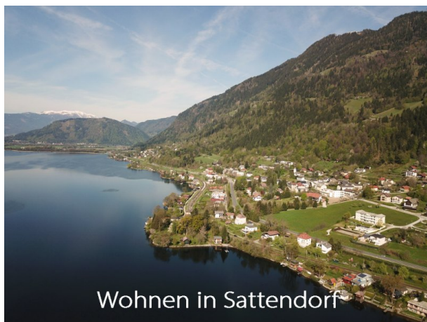
Wohnen in Sattendorf