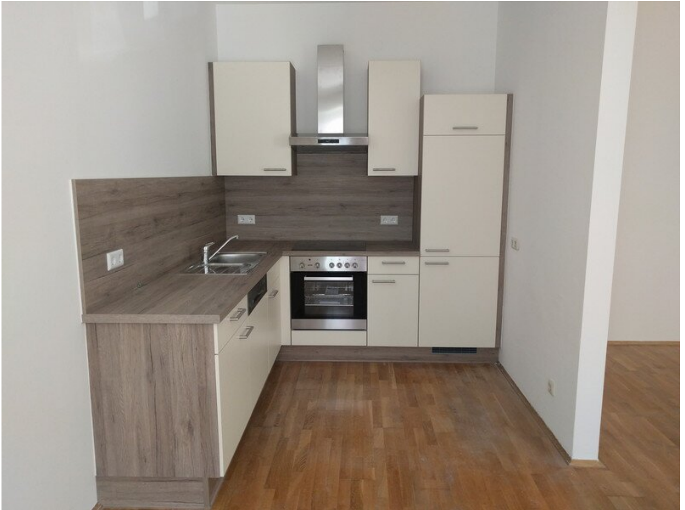
1 Küche Leitnergasse