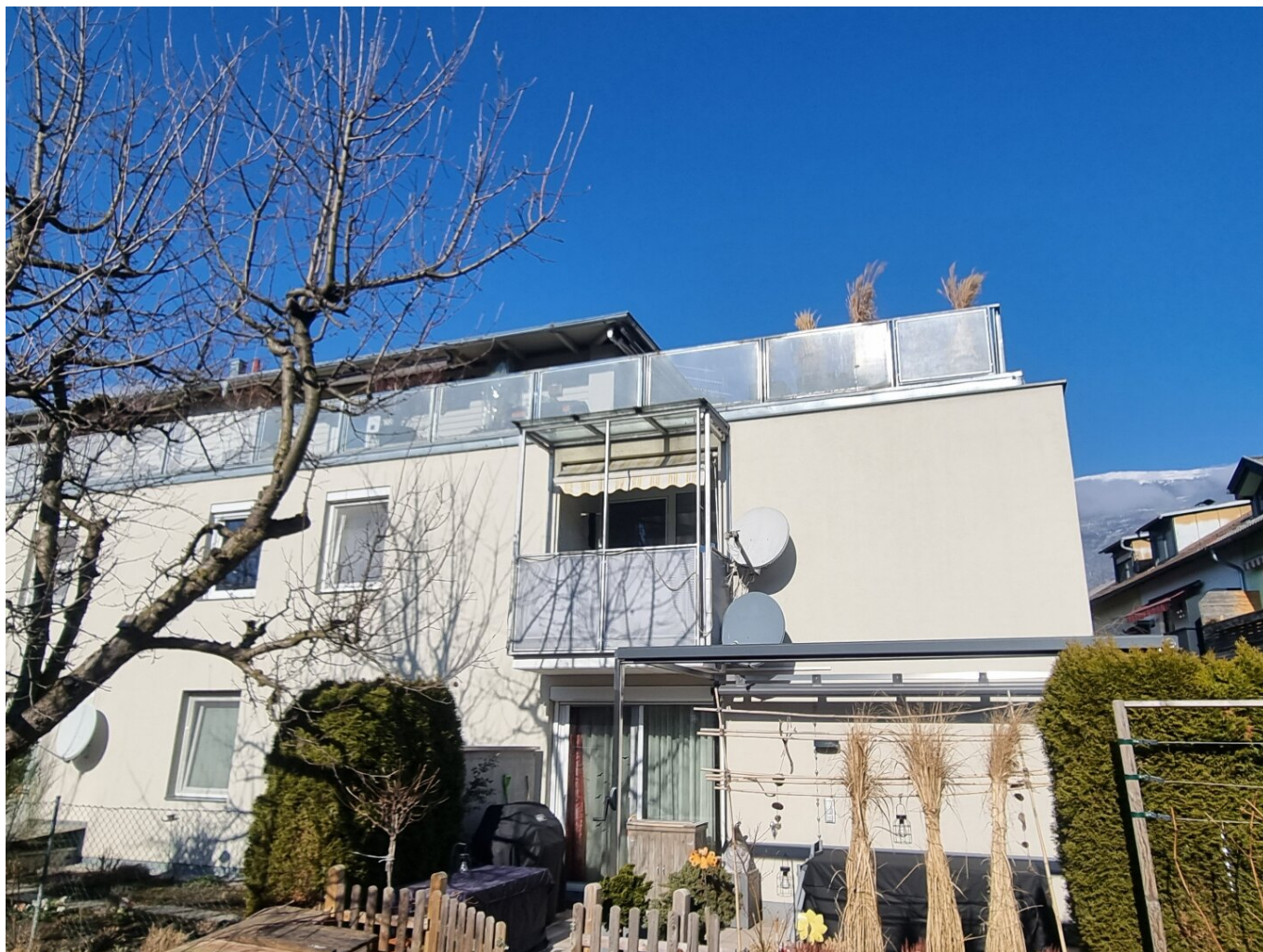
Wohngebäude mit zugehörigen Balkon