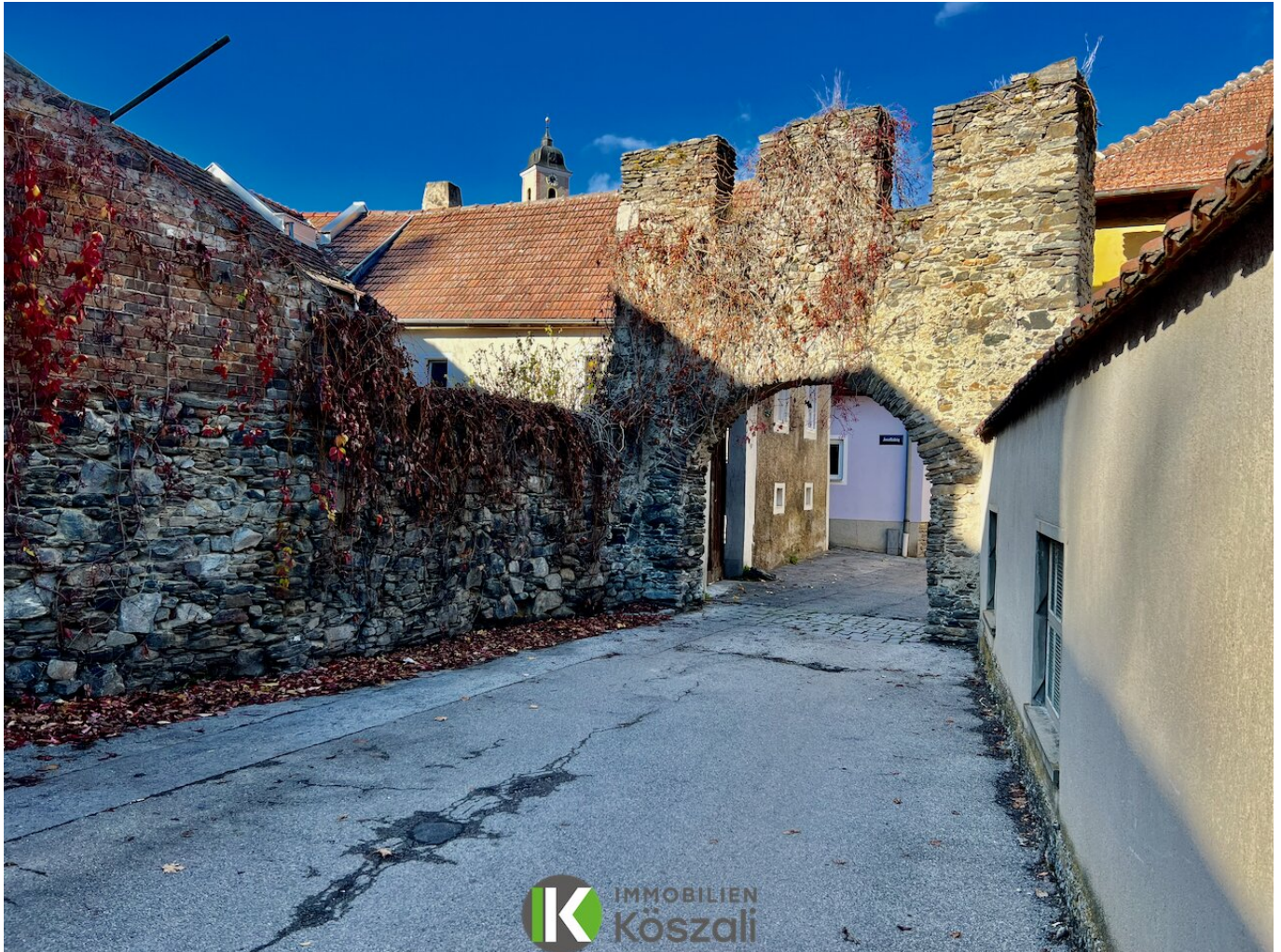
Zufahrt über Stadttor