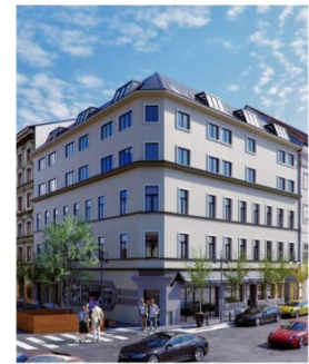
10. Angeligasse 41