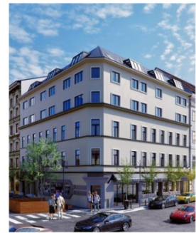
10. Angelegasse 41