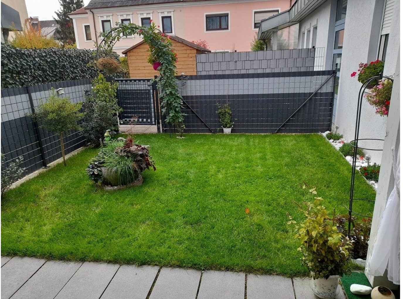
Kompagnon Immobilien Garten