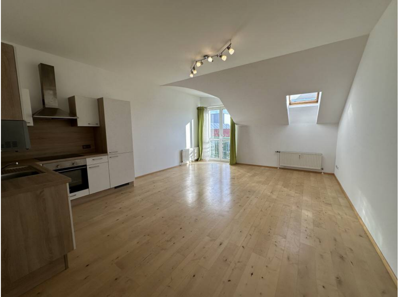
Raum 1 (1)