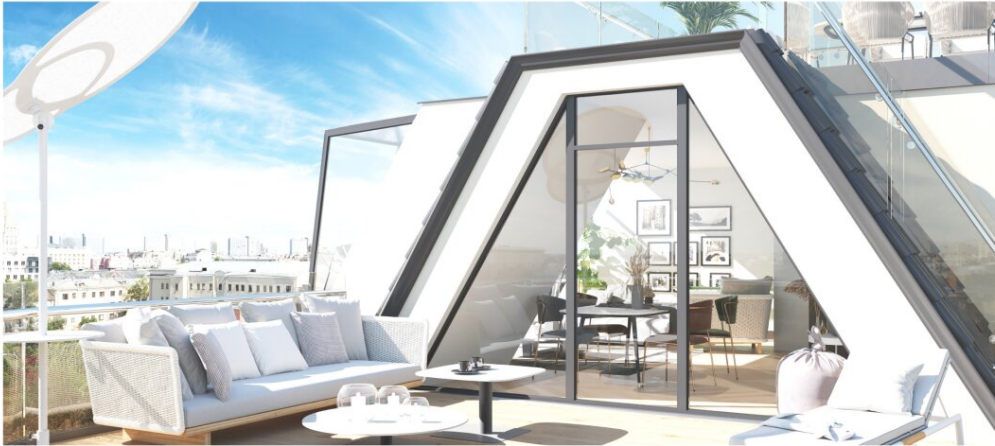
SCHOKOLADENFABRIK T41 1150 WIEN