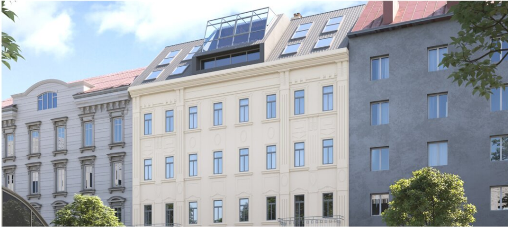
SCHOKOLADENFABRIK T19 1150 WIEN