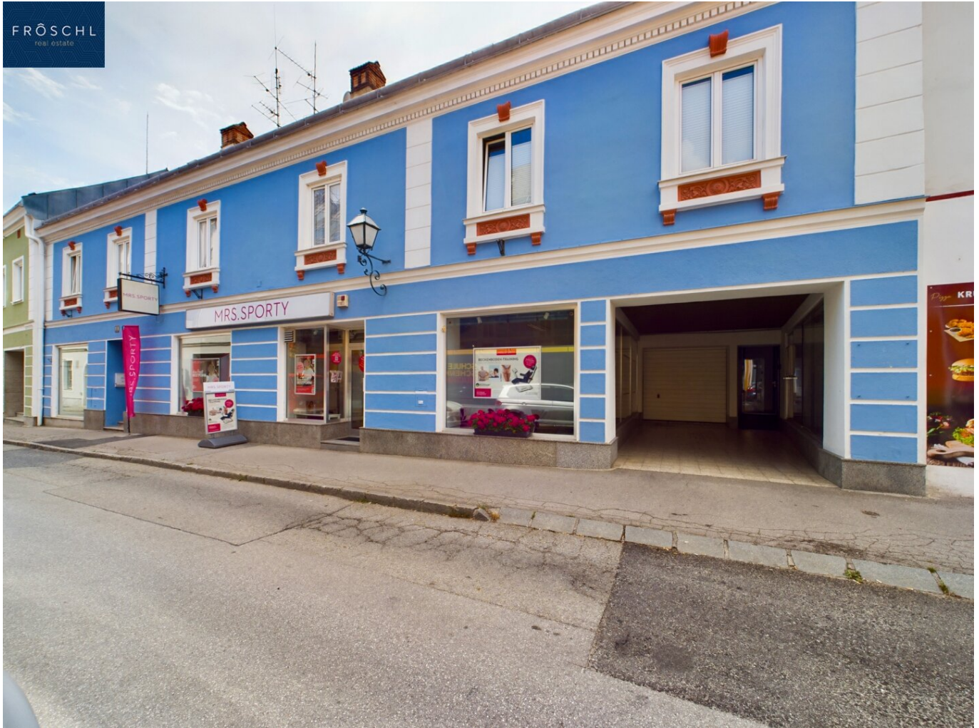
Ansicht - Mrs. Sporty