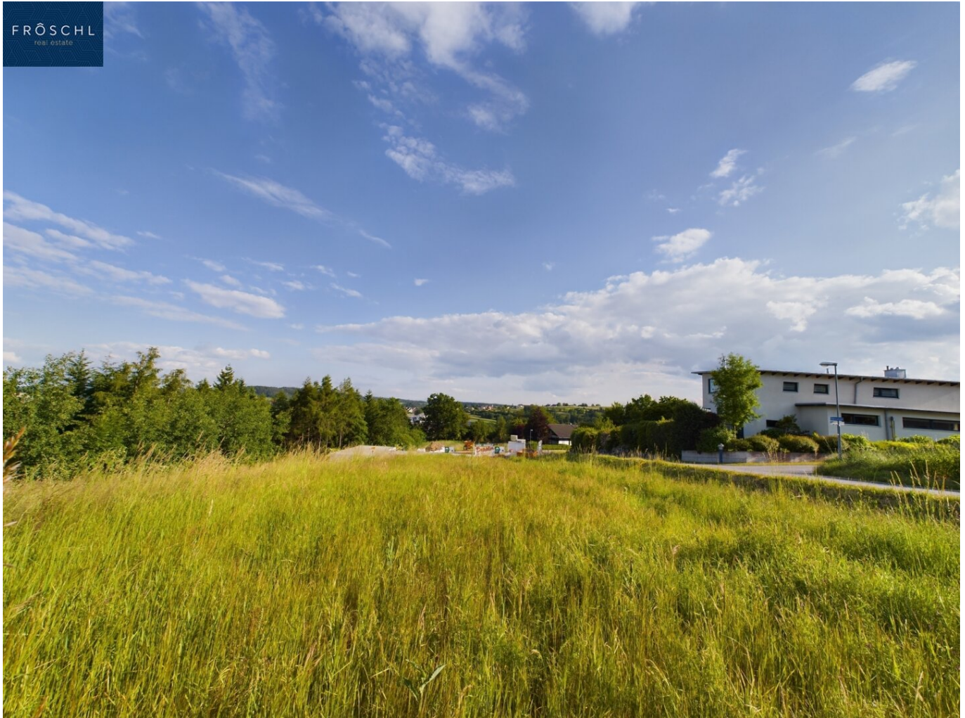
Bauplatz 2_Südhangstraße_8_Ansicht 3