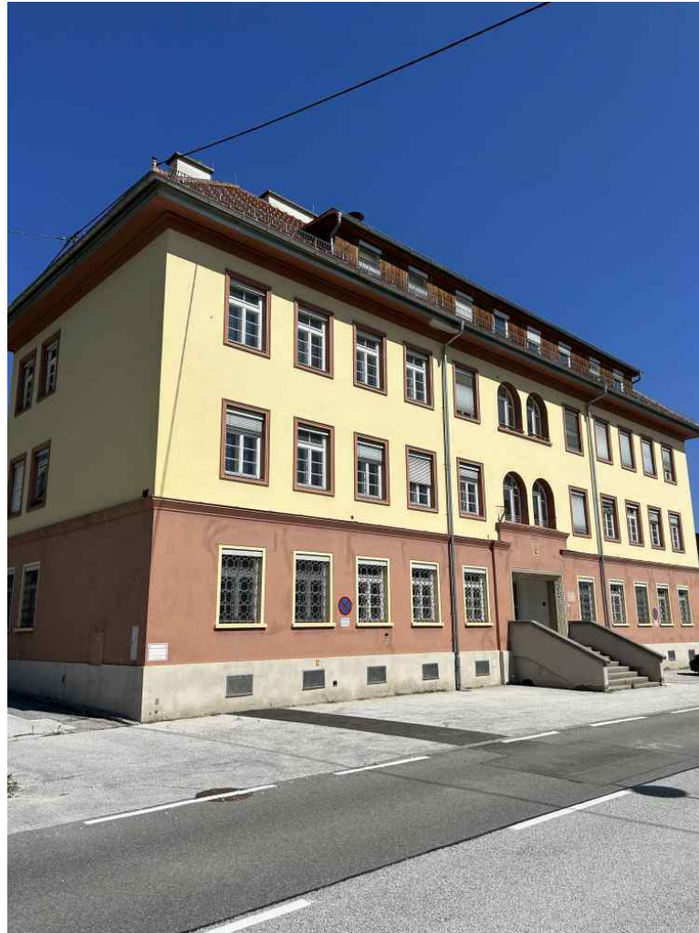
Straßenansicht mit P

Objektnummer: 141/78229 Eine Immobilie von Rustler