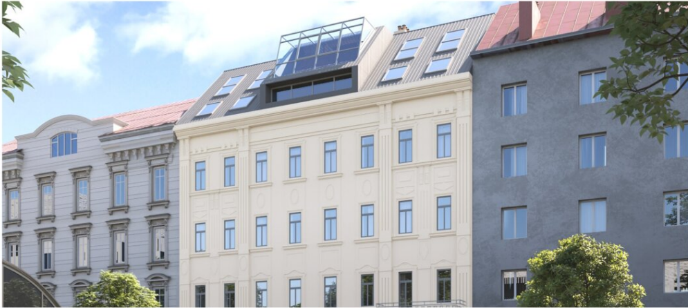
SCHOKOLADENFABRIK T7 1150 WIEN