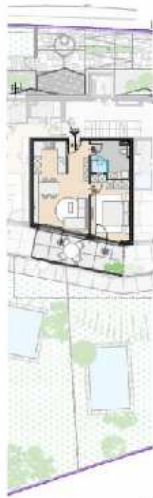
GRUNDRISS M= 1:250