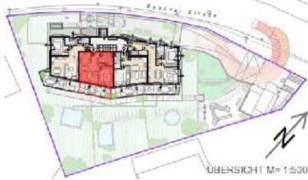
ÜBERSICHT M= 1:500