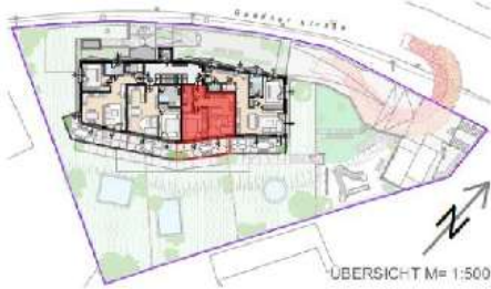
ÜBERSICHT M= 1:500