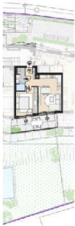
GRUNDRISS M= 1:250