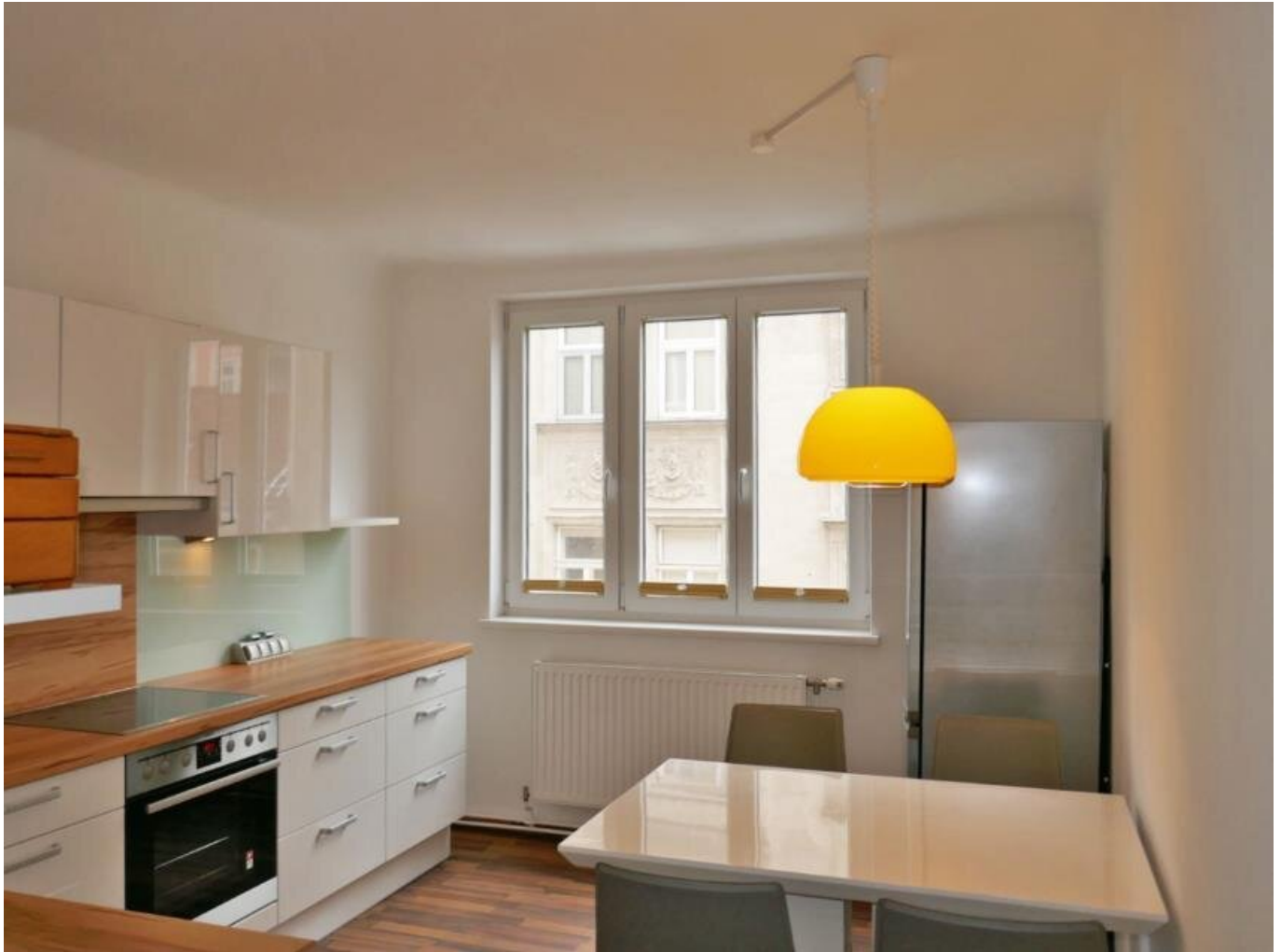
Wohnküche, DAN Küche