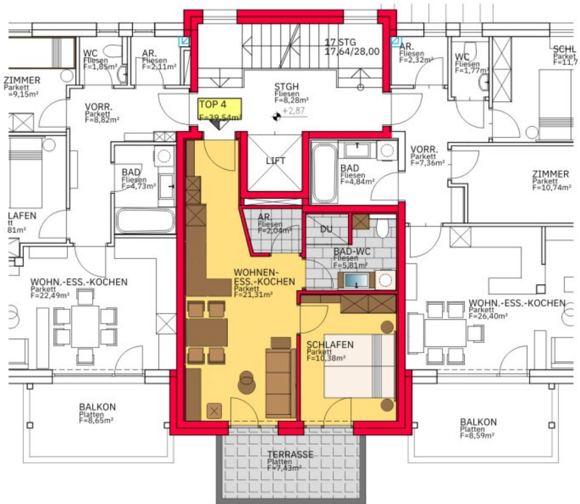
OBERGESCHOSS M 1:100