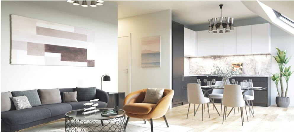
SCHOKOLADENFABRIK T10 1150 WIEN