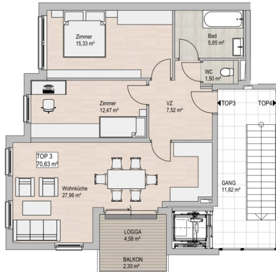
GRUNDRISS 1.OBERGESCHOSS 1/100