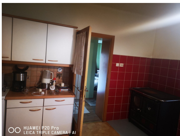
OO HUAWEI P20 Pro LEICA TRIPLE CAMERA | AI