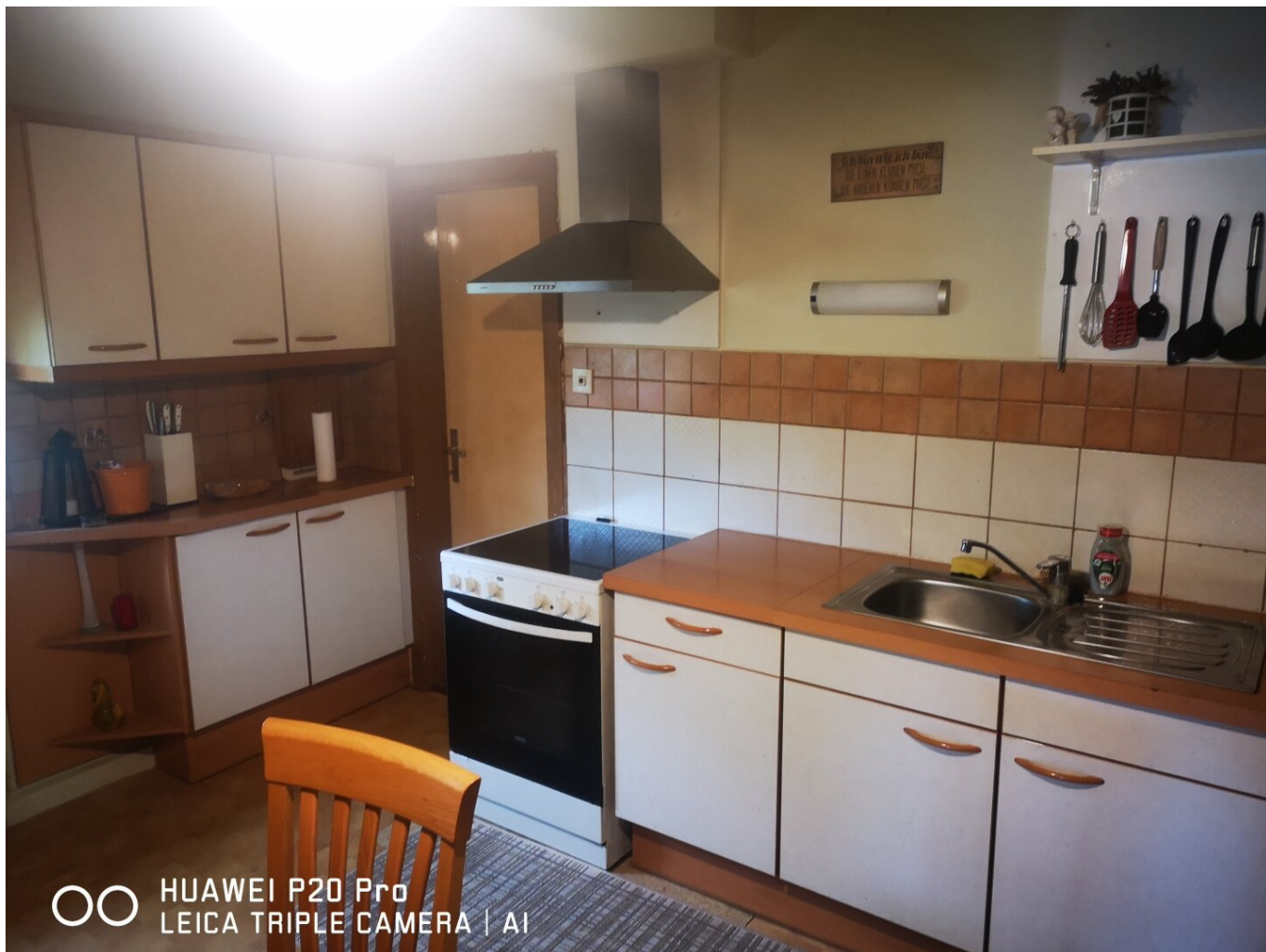
OO HUAWEI P20 Pro LEICA TRIPLE CAMERA | AI