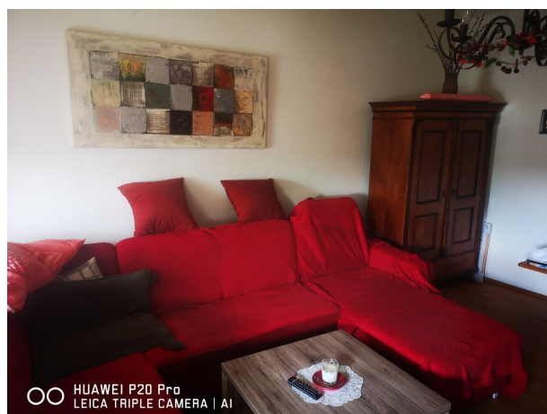
OO HUAWEI P20 Pro LEICA TRIPLE CAMERA | AI