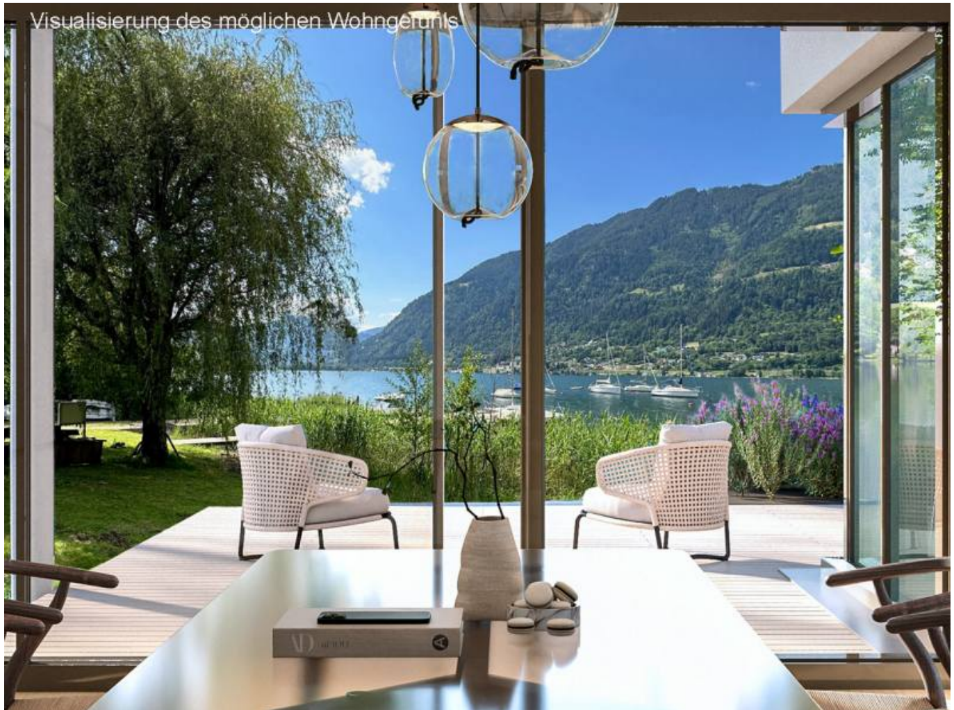
Seeblick Traum Visu

Objektnummer: 905/03281 Eine Immobilie von ATV Immobilien