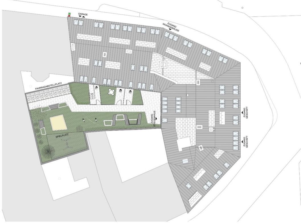
LAGEPLAN M 1:200