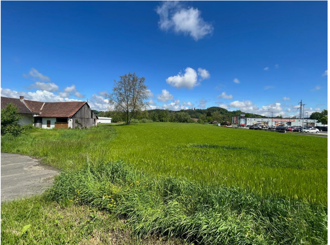
Blick Ri Norden

Objektnummer: 7753/1084 Eine Immobilie von IMMONATION