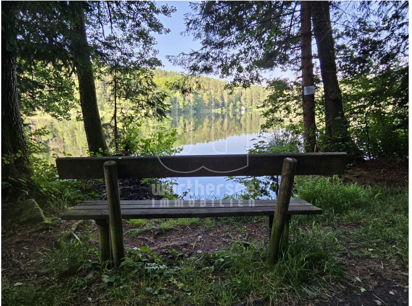
ein Ruheplatz im Schatten am Saissersee