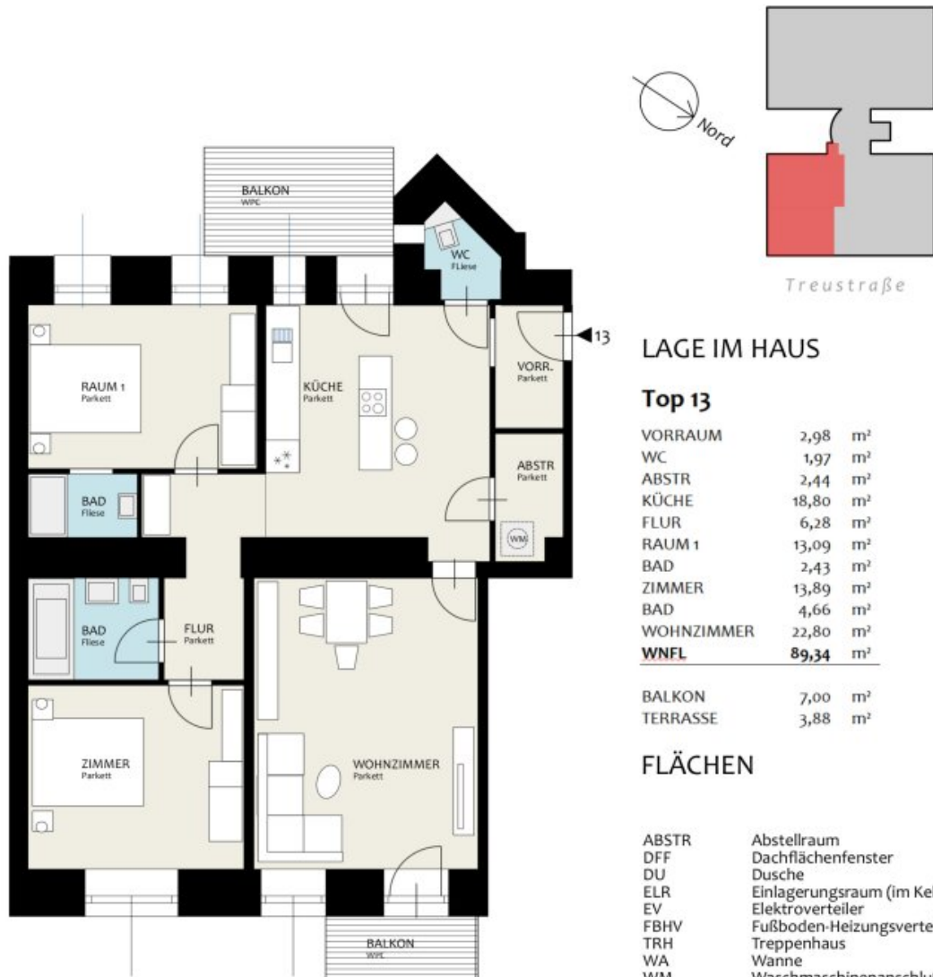
GRUNDRISS 2. STOCK