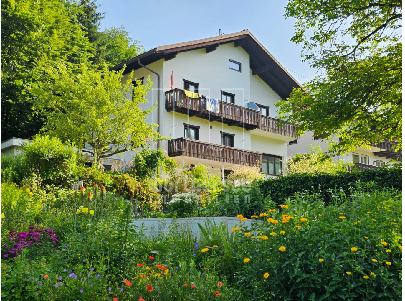
Südansicht auf das Apartmenthaus