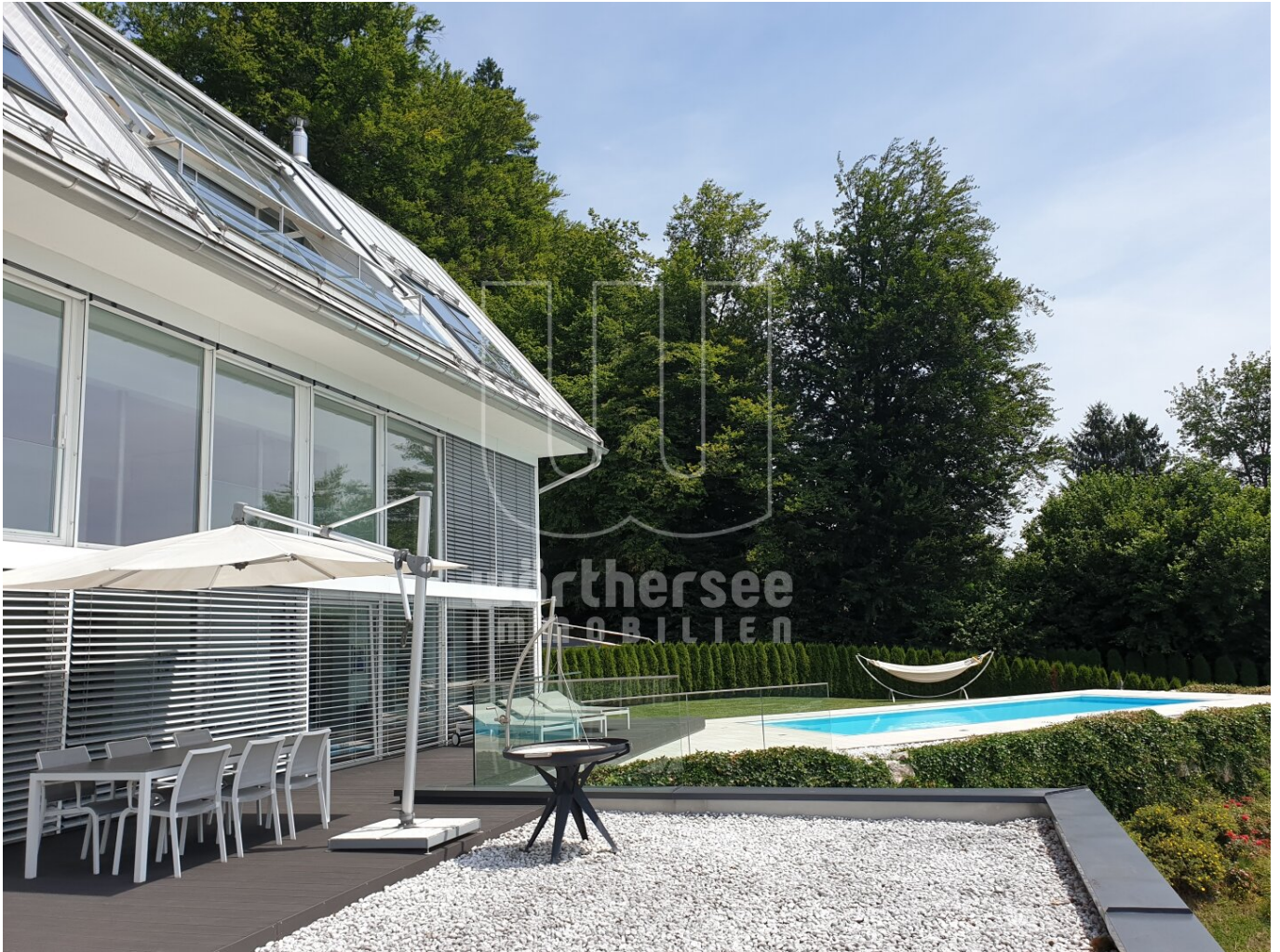
Blick von Westen auf die Terrasse