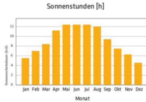
Sonnengang am 16.05.