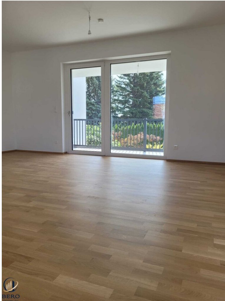
Wohnzimmer mit direktem Zugang auf die Terrasse