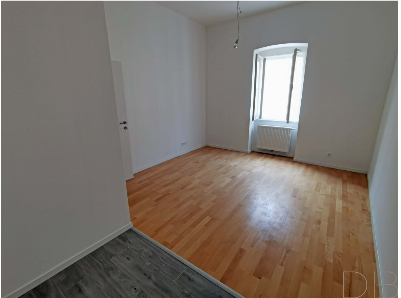
Küche / Wohnraum