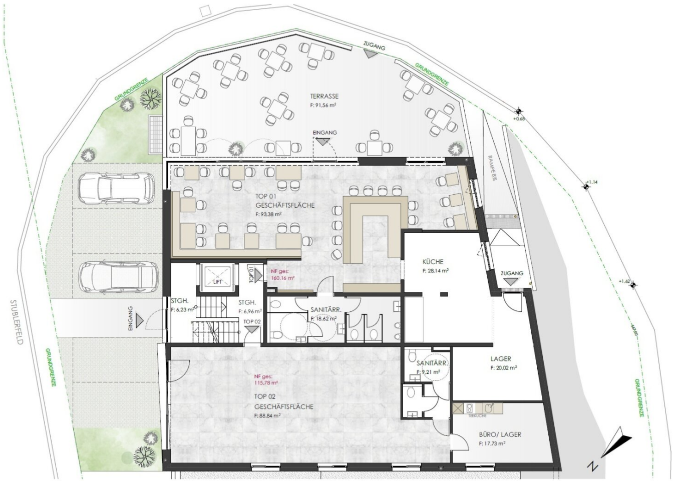
GR. ERDGESCHOSS 1:100