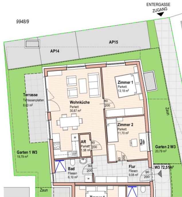
WOHNUNG 3 ERDGESCHOSS